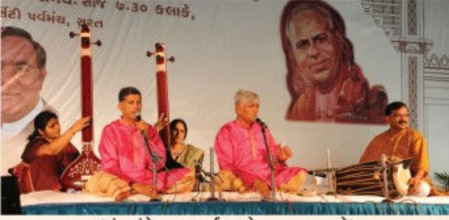
(પં. ગુંડેચા બ્રધર્સ અને સહકલાકારો)