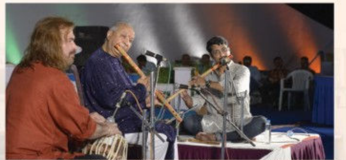
(પં. હરિપ્રસાદ ચૌરસિયા અને સહકલાકારો)